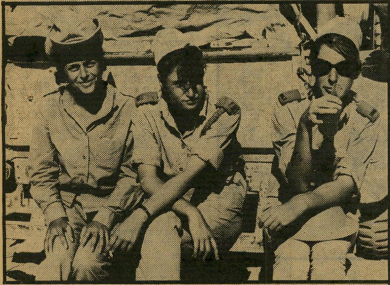
מריכות בנח"ל שירות בלי אחריות?

מסלול הבנות שונה: הן עוברות טירונות הולכות לחצי-שנה להיאח-זות שלהן, שם הן מצטרפות לבנים של הגרעין. אחר-כך, תות הבנות בתפקידי מינהלה במסגרת הביטחון השוטף, שאותו עוברים ה"ר