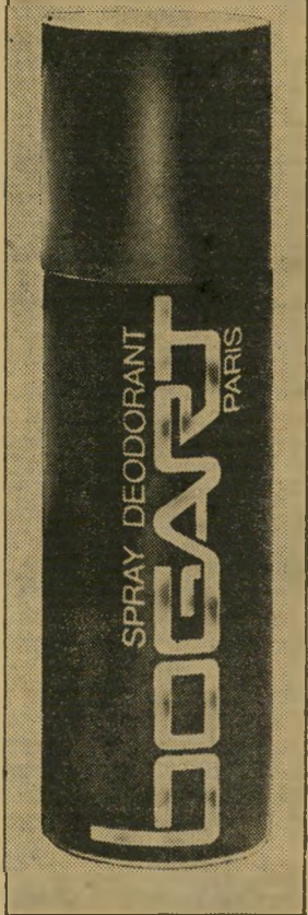
אשרו יאית כרמחאים נעים

יש משהו בשם בוגרט שונים אינו יכול לעמוד בפניו..!