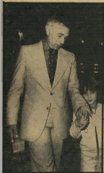
ניצב טיומקין מי חקר?

בינתיים הגיעה התיגבורת: שיבעה שוטרים, שהצטרפו אל השוטר שגילה את החשוד. על-פי הוראות שהגיעו אליהם