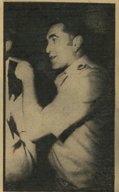
ניצב בר מי תפס?

אולם איז התגלתה לשני השוטרים ה"אמת המרה: האנס המנומס, אם הוא אכן האנס, אינו מנומס ביותר. הגבר גבה הקומה, בעל מיבנה-גוף רחב, ממוצא מיו"ר, חי, הסתער עליהם וחבט בהם ברצחנות. שישה השוטרים הנותרים מיהרו לעזור ל"חבריהם, אולם גם הם לא נמלטו מנתח-זרועו של הגבר בן ה"37 שהשתולל כשור בזירה. רק אחרי מאבק עז, הצליחו שמונה ה"שוטרים להתגבר עליו ולשים את ידיו באזיקים. קורבנות הקרב: שני שוטרים פצועים בבית-החולים מאיר ושישה שוט-