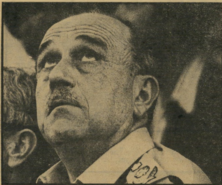
מפכ"ל תבורי מי הדליף?

היתה מוכנה להישבע כי החשוד אינו, ולא יכול כלל להיות, האנס המבוקש. המכר שהוכחה מישפחהו של החשוד היתה כפוי לה ומכופלת. בשבוע הבא עומדת להיערך הגיגת בריהמיווה של אחד משלושה בניו של האיש, וההזמנות למאות ידידי וקרובי המישפחה בכל רחבי הארץ כבר נשלחו. "הוא אדם נהדר", סיפר עליו אחד ממכריו ושכניו השבוע, אחרי שנודע מן נעצר בחשד שהוא האנס המנומס. הוא לא מסוגל לפגוע בזכו. כל מי שמכיר אותו לא יאמין שהוא האנס, אפילו אם הוא עצמו יודה בכך מאה פעמים". אולם חוקרי המישטרה טוענים אחרת לדיבריהם מתאים תיאורו של החשוד לתי אור שמטרו אחרות מהנאנסות על-ידו שמהן ניתן לדלות פרטים לגבי היצוגיות הן רבות מהן זכרו בבירור שומה מכוונת רת שהיתה על מותנו של האנס, ואכן שומה כזו נמצאה על מותנו של החשוד שנתפס.