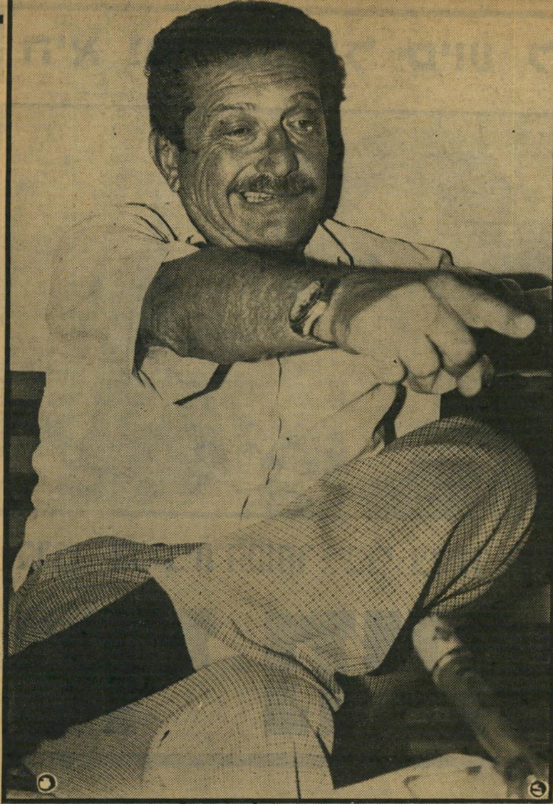
עזר וייצמן: „שהממשלה תישק בחחתי“!