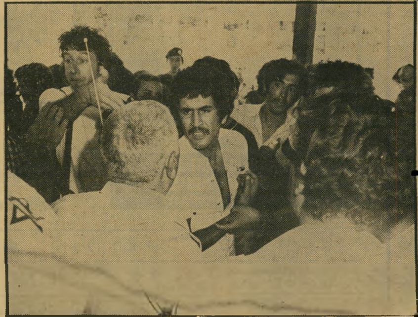
סרנים מונעים מסטודנטים להיכנס להרצאת שרון הכנות לניסיון-התפרצות

„לא יהיו כל ניסיונות להיכנס לאולם בכוח,“ קרא ברמקול אחד המפגינים נגד מדיניות הממשלה והשר. כאשר נשא השר את דבריו באולם, עמדו המפגינים בחוץ כשהם מתוחכמים עם אנשי-הביטחון הרבים בפתח, שמנעו מהם א תהכניסה. הסטודנטים, חלקם מבני-המי-עוטים, דרשו שיינתן להם להיכנס לאולם, שהיה מלא רק בחלקו. אך כיוון שלא היו מצויידים בהזמנות הדרושות נמנע מהם השר כמעט הפכו תיגרה רבת-משתתפים.