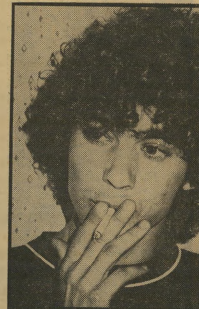
משוחרר וייצמן, אליבי לכל עת.