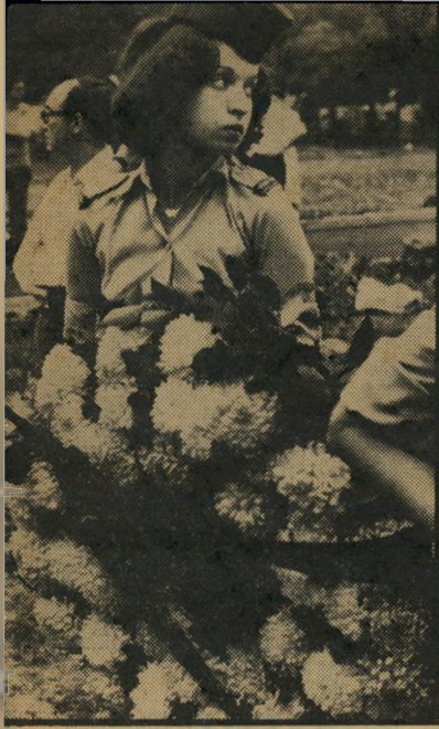
גלי צה"ל צבאית גלי צה"ל היו המומים. חיילת מהתחנה מניחה בעצב זר על הקבר הטרי.

הנוח את משפחתו, וכי לו עצמו יש יד בטרגדיית הגירושין של בתו, אפילו שקל התפטרות מתפקידו כשר (העולם הזה 2112) כדי להקדיש זמן רב יותר למישפחה ולהראלה.