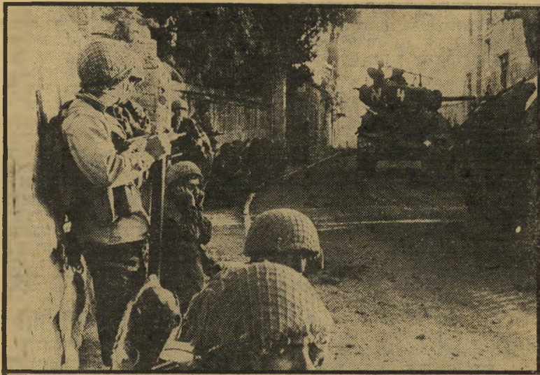
כיבוש ירושלים: יוני 1967 חומר הנפץ נשאר

ייתכן שרק בעוד חמישים או מאה שנים יוכלו ההיסטוריונים לקבוע אם התאריך