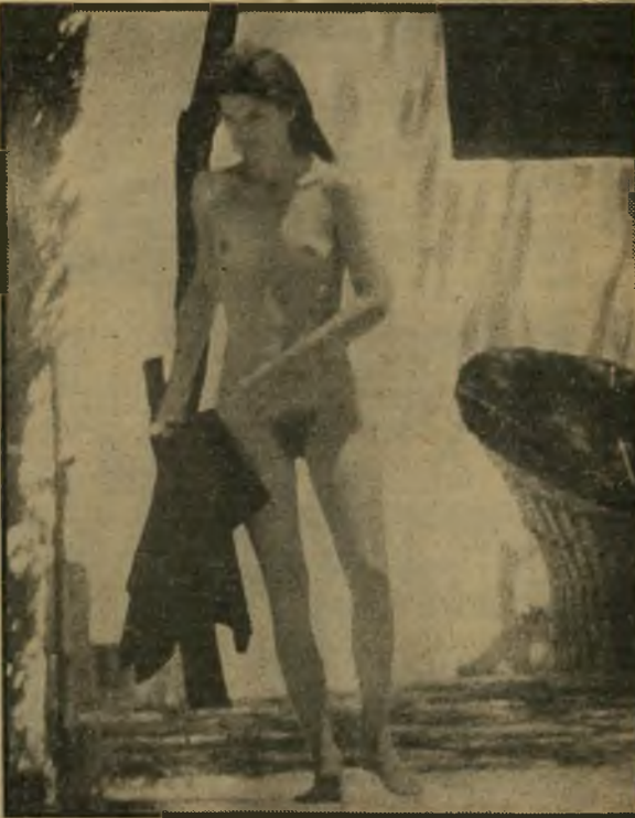
ז'אקלין קנדי-אונאסיס באי סקורפיו ובחוף קיסריה שיחזור