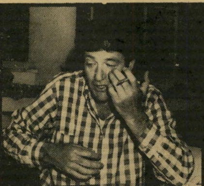
מרד רועה נגד תחזית

מאותו היום, שבו "הציע" קומיסאר רשות השידור, יושב-ראש הוועד המנהל, הפרופסור ראובן ירון, שלא לשדר ב-