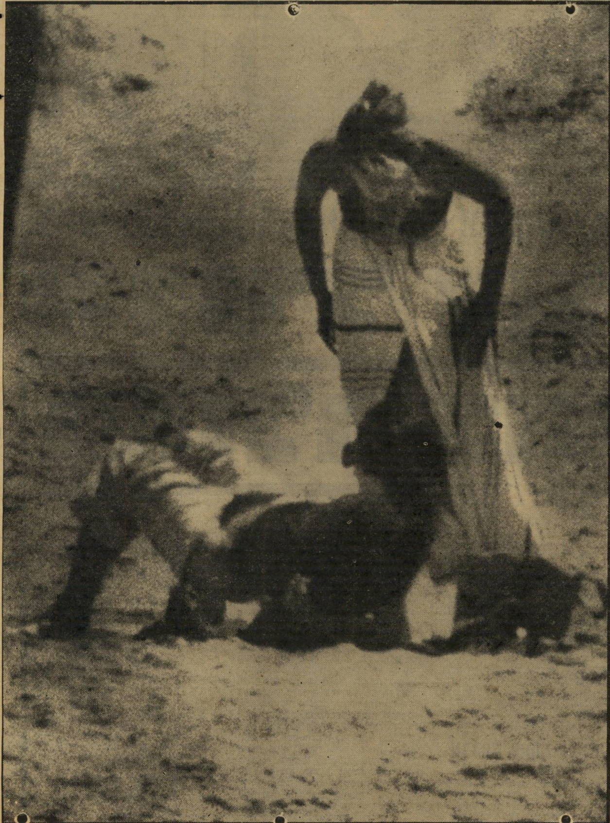
אחרי שהורידה את בגדיהם הרטוב ונשארה חצי עירומה, לובשת