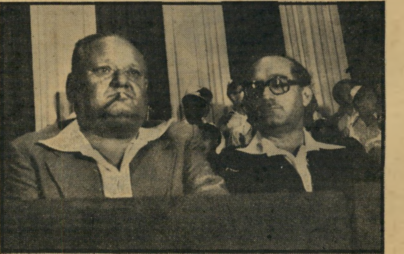
מוזכ"ל-נכנס ורמוס ומוזכ"ל-יוצא בן-נתן המלכים מתו - ימי המלכים!

בורג הוא חבר הממשלה היחיד הי מכהן כשר משך 25 השנים האחרונות וכ"כ מאז כינונה של הכנסת.