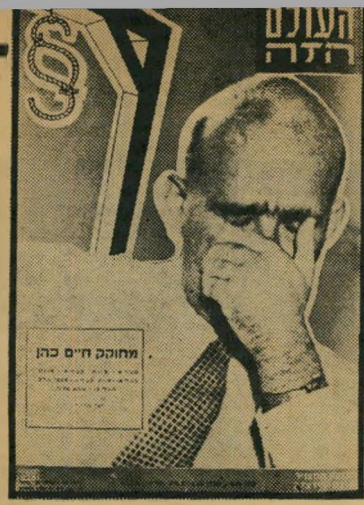
"העולם הזה" 812 תאריך: 14.5.53

חמת העולם השניה. כפי שהוכח (בקול העם) בימים האחרונים. הוסיף קול העם: "מיד לאחר המלחמה פתח דאלס בתעמולתו הצינית למלחמה חדשה, בשור הלל למירוץ היוון ולדיפ-לומטיית האטום." בגד הכתבה פורסמה קאריקטורה פוליטית רגילה על מזכיר המדינה האמריקאי.