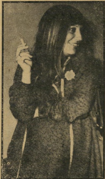
מזכירה כהן הלוואה