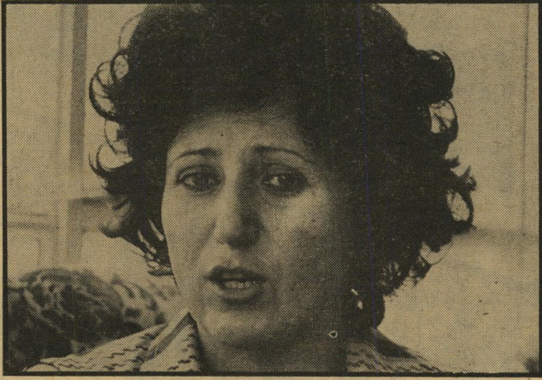
עצורה רמונדה אל-טאוויי לא לערבים בילבד

טיפוין-טיפון מחלחלות לכל גיורות החברה הישראלית ההגבלות החדשות על חופשי-הביטוי. בשבוע האחרון בילבד הן התגלו בשורה של תופעות התבט-איות, ההיבנות להועיק כל מי שחרד