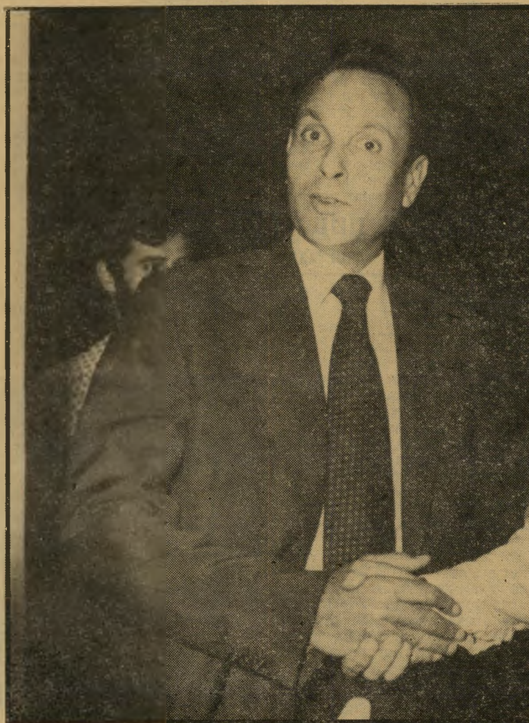
קימסופר מודעי אפשר בלי הגבלת תקציב

אחת ההפתעות אותה ביקש בגין להור-ציא מהשרוול במיצעד הלוחמים היתה צריכה להיות הופעתו הראשונה של טנק המרכבה הישראלי. בכדיקות שערכו אנ-שי השיריון וההגדה התברר כי אם ינוע