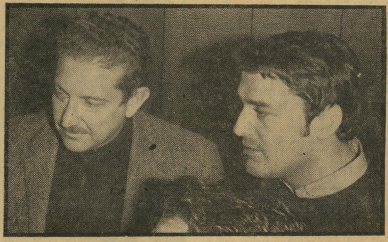
איש־עמקים קולין והשר וייצמן מי עשיר, מי חשוב