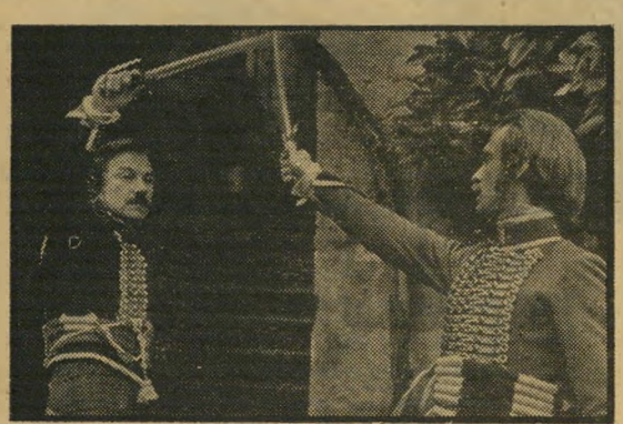
קארדין וקייטל: הופעה משכנעת

הדואליסטים (פאריס, תל- אביב, אנגליה) — ג'וזף קונראד הוא סופר שכמעט שאי-אפשר לעבדו לקולנוע. כל מי שניסה עד עתה — נכשל. וה- תוצאות היו כישלונות מפוארים, או כישלונות מכובדים (למשל: לורד ג'ים של ריצ'רד ברוקס), אבל לא בדיוק הצלחות. אל שורת הכישלונות המכובדים אפשר להוסיף עתה גם את סרטו החדש של וידלי סקוט. הסיפור הקצר של קונראד מתאר שני קצינים בצבא נפוליאון (דמויות המבוססות, בצורה רופפת, על אנשים חיים), שבילו את כל תחילת המאה הקודמת בדו-קרב אחד ארוך. בכל פעם שנפגשו, שלפו חרבות, בין אם היה זה באירופה-המערבית ובין אם בערבות רוסיה, לשם הגיעו שניהם עם צבאו של הקיסר. הם עלו בדרגה, אבל הטינה שביניהם לא נמוגה, גם כאשר סיבתה של טינה זו נשכחה. מי שרוצה להתעמק בסיפורו של קונראד יכול להסיק מתוכו שהאדם הוא זאב טורף. כמו כן הוא יכול ללמוד משהו מן הנושג הכבוד ומעגלי הקסמים של האלימות, הסוחפים אנשים פרטיים לדו-קרב אומות — למלחמות. בעייתו של סקוט שהיה עד כה במאי סרטי-פירסומה, היא אורכו המלא של הסרט. הסיפור של קונראד קצר לחסית, ואילו בסרט חייבת העלילה להתפשט אל מעבר לממדיה הטבעיים, ומרגע מסויים והלאה היא חוזרת על עצמה. ומאחר וסקוט מעדיף להשאיר את הטינה על המי-