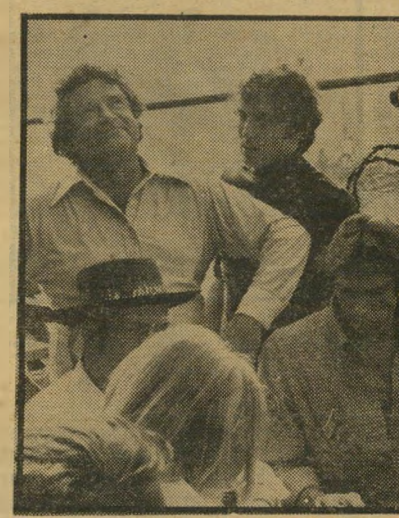
גולן מכינים את „קשר האורניום“ סוכריות מתפוצצות בקאן

ריסט חסרי-נשמה, יכולה לרמוז על דעותיו הפוליטיות של השחקן, או על רצון לחסל חשבונות עם פוליטיקאים. אך כל העניין מתרחש במישור היצוני לחלוטין, עם אישים שמשחקים בפוליטיקה, באהבה ובהכרות דרמאטיות. לכן קשה להניח שמישהו נפגע באמת מן הסרט. ואשר לצו- פים — הם יכולים להתנחם בצורתם האסתטית של דלון ושל סידיני רום (הדוגמנית) או בהופעת אורח קצרה של ז'אן מורו. גם זה משהו.