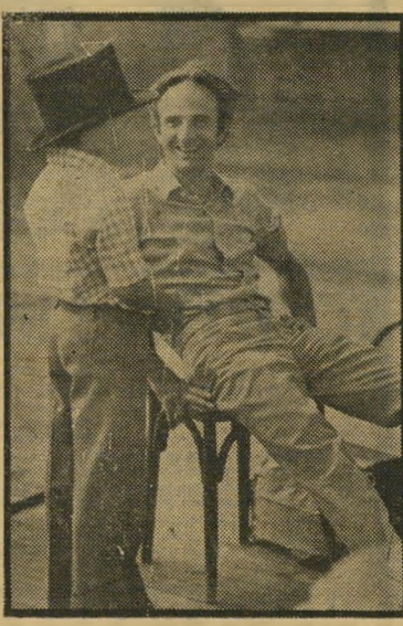
טריפו מכינים את „רמוי כים“ „גיליתי את השחקנים“

עשרים שנה לאחר שכבש בסערה את פסטיבל קאן עם 400 המלקות שלו. נחשב היום פרנסואה טריפו לאישיות הקולנועית מס' 1 בצרפת — לא רק כבמאי אלא גם כשחקן. האיש, שהחל כבמאי של סרטים אישיים מאד, מצא בסופר-שלידבר לנכון, להופיע בעצמו לפני המצלמה. השנה אפשר יהיה לראותו פעמיים כשחקן, פעם בהפקת הראווה האמריקאית מ'פגשים מן הסוג השלישי ופעם נוספת בהחדר הירוק, אותו ביים בעצמו. „בפעם הראשונה החלטתי לשחק שעה שהכתי את הסרטת יד הפרא. פשוט קנאתי באיש שצריך היה לגלם את הרופא המטפל בילד ומדריך אותו, נוטל את ידו, מוביל אותו אל החלון או אל השולחן. כל זה ניראה לי אישי כל כך, שלא יכולתי להשלים עם הרעיון שאצטרך להדריך שחקן אחר בתנועות אלה. חוץ מזה, היה ברור לי שאיני רוצה כוכב שיאפיל על הילד.“ הפכמה מתוך עקרונות. מאז הופיע