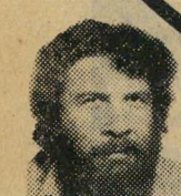
VERY WANTED מבוקש מאד

רח' הצדף 6, יפו. סוף רח' יהודה הימית ליד הנמל, טלפון 831782.