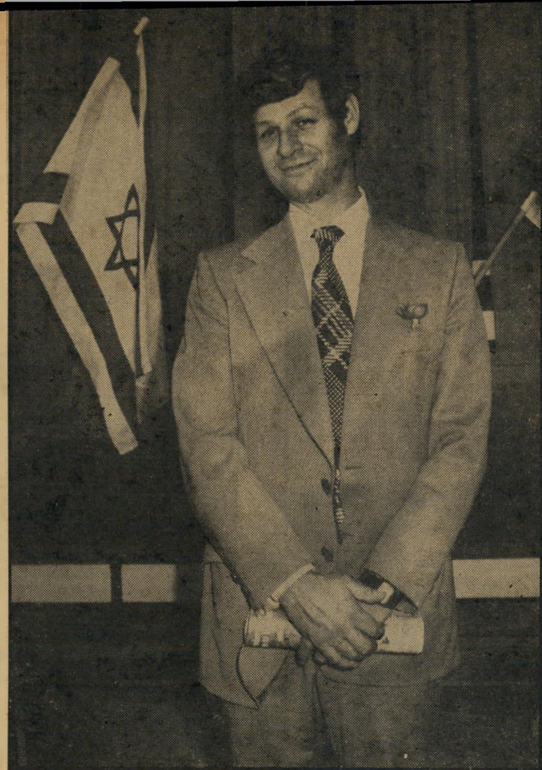
מנהל יבין ללא צוות

ללא שינוי. ביום ה' יחליף פולדארק חלק ב' את שורשים, אלא שהסידרה תוון בחזרה לשעה 10.20, ואחרי מבט תשודר תעודה, כמו בימים שקדמו לשורשים, למי שזוכר.