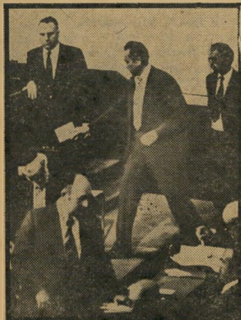
בעד שר האנרגיה והתשתית, יצחק מודעי, הימרה את פי מיפלגתו והצביע בעד נבון. הוא אמר אחר-כך: „אני גאה באופן שבו אני הצבעתי“