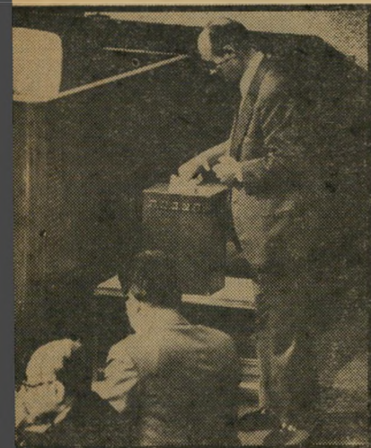
בעד שר-החוץ משה דיין, חבר-מיפלגתו-לשעבר של יצחק נבון, רפ"י, הצביע גם הוא בעד נבון.