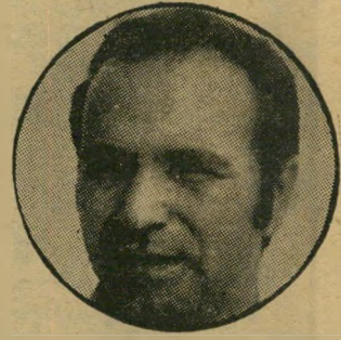
יזעקון פת: שירת בצה"ל תקופה קצרה בזמן ביגוד- שהות ממושכת בחוף-לארץ.