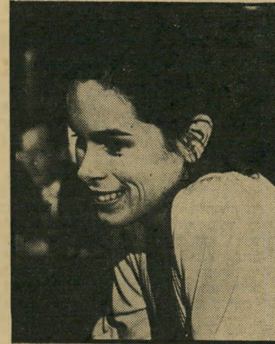
ג'רארדין צ'פלין ב"רוזלנד" נוסטאלגיה והומור

כל עוד עבד בהודו, בלט בסרטיו של אייבורי המבט הרגיש והמבין, גם אם היה זה מבט של איש המערב, על בעיר תיה ואורחות-חיה של ארץ זו. מאז פרש