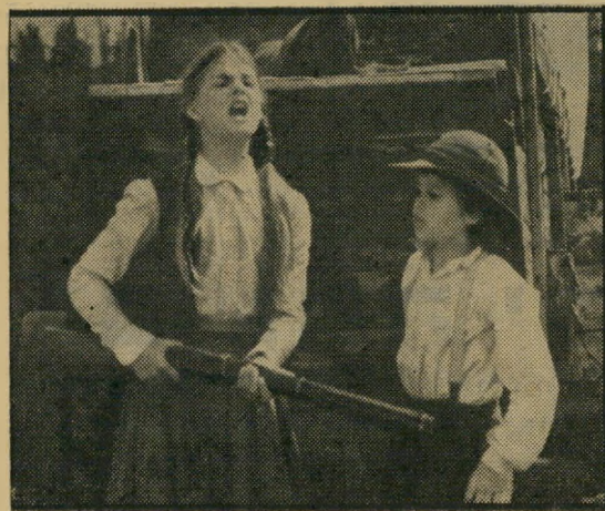
ראטריי והול: שחקנים ונופים מרהיבים

מעשה באח ואחות, היא כבת 14, הוא כבן 10, העומדים לחצות את הריה המושלגים של מערב ארצות-הברית, כדי להגיע לאחוזה שקיבלו בירושה אי-שם באורגון. מי שעוזר להם להגיע למטרתם ולעמוד בפני קשיי הדרך וסכנותיה הוא מהמר עליו, שנמלט מכמה חברי-למישחק מן המיזרח, הרודפים אחריו עם סולם וחבל. השלישיה העלזיה אינה מדלגת בדרך על שום סכנה אפשרית: אינ"דיאנים, דובים, חתולי-בר, זאבים, שלגים, סוסים בורחים, ביוונים המנסים לגזול את רכושם. אבל בסרט כזה ברור, שכל הקשיים נוצרו רק כדי שאפשר יהיה להתגבר עליהם, כי הרי אין איש מטיל ספק שחסוף יהיה טוב. העובדה שהילדים תמיד נקיים להפלא, גם אחרי ש-התגלגלו בבוץ, שהמהמר נשאר מוגהץ ומצוחצח גם אחרי שישן בלילה בבגדיו היחידים, שהשלישיה עושה למראית-עין דרכים ארוכות מאד ללא מוזן ומים, כל אלה הם