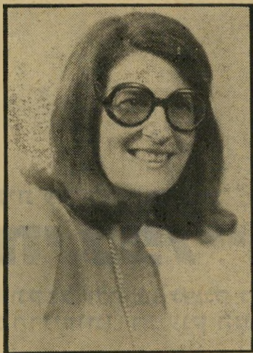
עורכת סופר הפגנה — כן או לא?

השביתה הרגיוה רבים ממשלמי האגרה, אולם ההפגנה היחידה שזיתתה כנגד הטל-