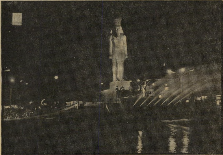
פסל רעמסס בכיכר רעמסס בקאהיר * האם ישחרר בגין את הפיראמידות?

"אחרון הפרעונים". כאשר כבשו כוחות צה"ל שטח מצרי ממערב לתעלת סואץ, הם קראו לו בשם התנ"כי "גושן". כאשר ביקרו הישראלים בקאהיר וראו את פסל-הענק של רעמסס בכיכר המרכזית ואת רעמסס החנוט במוזיאון, נזכרו בשם רעמ-