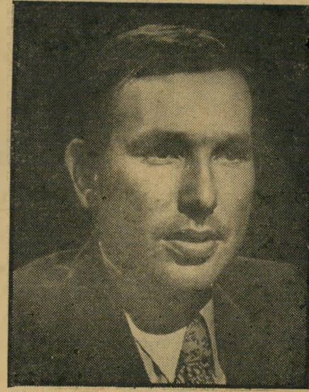
משתלם לנרדן באירופה

אזרחים ישראלים, המבקשים לתרום מוח עצמות.