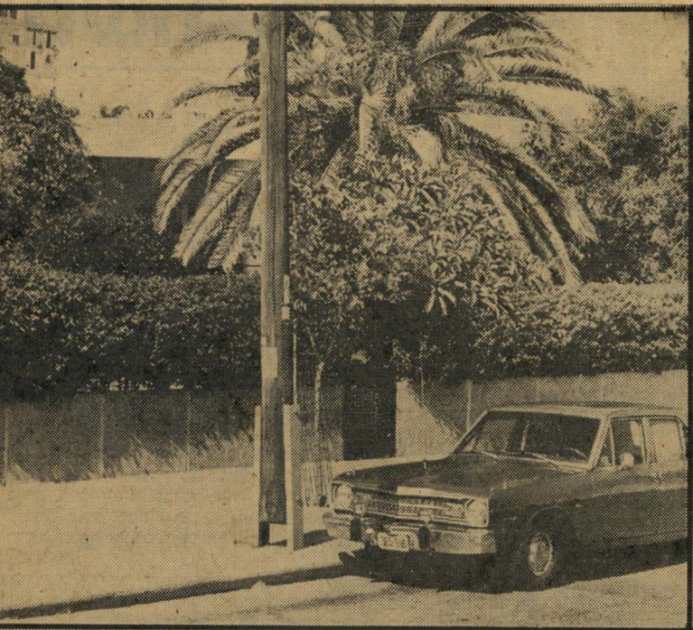
הווילה בחולון: מדוע זקוק ישעיהו לדירה נוספת?

* בעת שישעיהו כיהן כיושבראש הכנסת, הוא אכל רק בלישכתו, ולא במיונון, וזאת משום שהארוחות בלישכה הן עלי-חשבון תקציב האירוח.