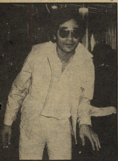
אנרי לוי דימוי עצמי

אז רק לשם אינפורמציה: הוא בן שלושים, ומת להתחתן. מי שמחפשת מיל-יונר מן המוכן, שהוא גם סופר כישרוני וגם נחמד אמיתי, הרי הוא מוכן ומזומן.