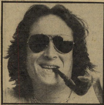
אלי ישראלי הטבה

תמיד האמנתי שזוגות נשואים צריכים להתראות רק כמה שעות ביום, לא יותר. לדעתי זה הרבה יותר בריא. מה שיותר רחוק — יותר קרוב. אבל יש, כנראה, כאלה שחושבים אחרת. קחו את שדרן הרדיו הפופולארי של גלי צה"ל, אלי ישראלי. הוא נשוי לבתיה היפה והמר תולחלת, אם בנותיו, והכל בחייהם שפיר.