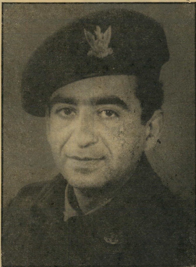
יצחק שווה במדי חיזיהאוויר בשנת 1953 "הברכיים כאבו ליו..."

ביום א' השבוע הגיע הפרופ' שווה לישראל, התקשר ללישכת ראש-הממשלה ונק' בעה לו פגישה עם מר בגין ליום ב'. בפגישה הגיש ראש-הממשלה לפרופ' יצחק שווה את הצעתו להיות נשיא המדינה. ניתן היה לצפות, שגלי הגיחוך הר' כלליים ירתיעו את מנחם בגין מתוכ-ניתו הראשונית. אפילו חסידי העיוורים בתנועת החרות, שקצו מייד לתמוך במוע-