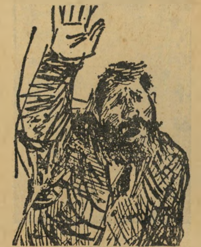
י"ח ברנר והרומן את ידי...