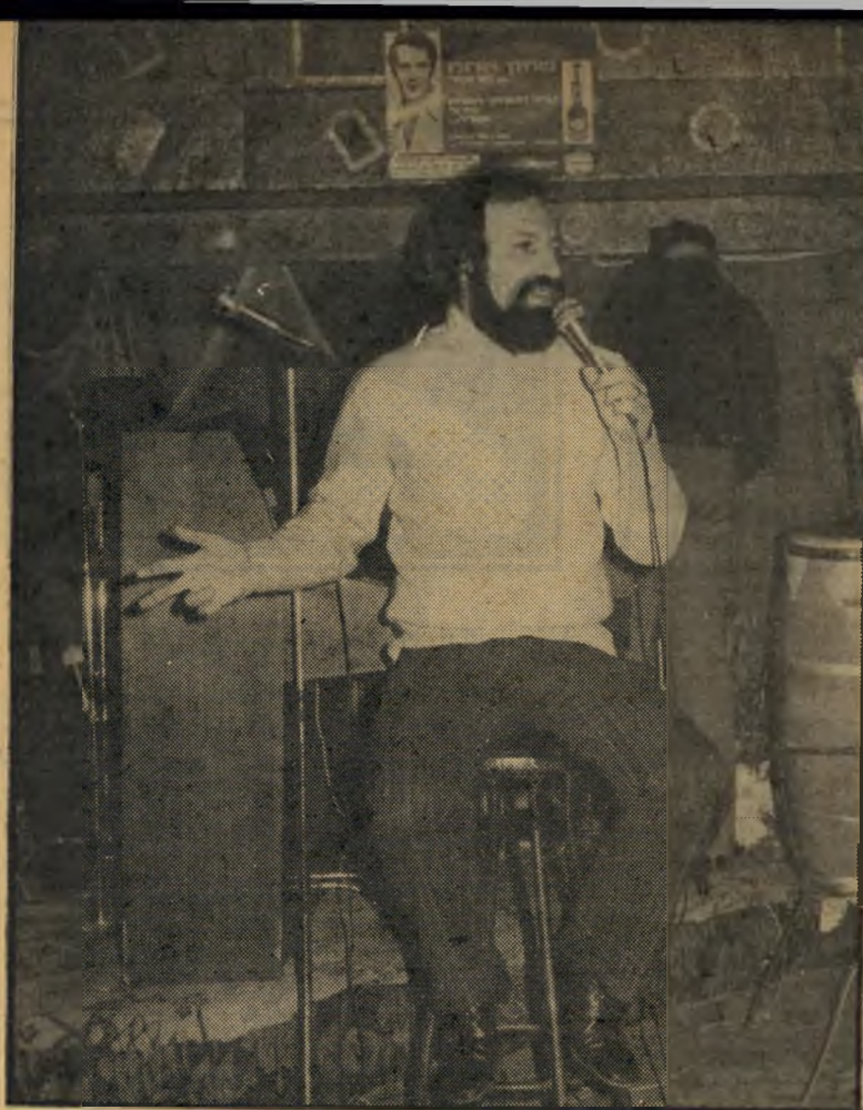
מלחין ח"כ נח מלח"כ

אחרונים, כשהם מתחלפים בתפקידי החתול והעכבר על-פי הנסיבות.