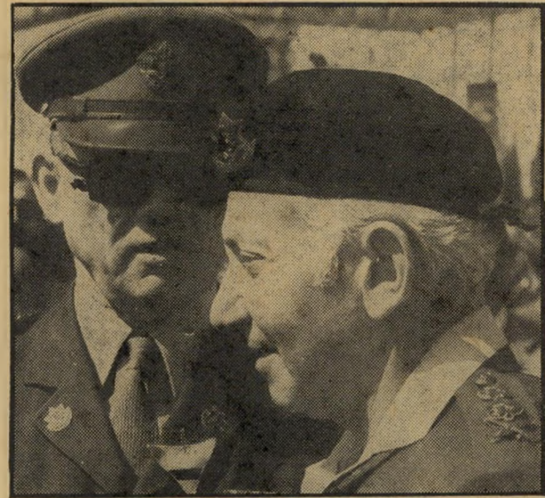
חיים ברילב וחיים לסקוב, הרמטכ"לים השמיני והרביעי של צה"ל, חיו היחידים מבין הרמטכ"לים-לשעבר של צה"ל, שלבשו את מדי הרב-אלוף שלהם, בטכס הלווייתו של הרמטכ"ל השלישי של צה"ל, מרדכי מקלף. שלושה רמטכ"לים-לשעבר אחרים שנכחו בטכס, יוגאל ידון, משה דיין ויצחק רבין, באו בבגדים אזרחיים, ואילו רמטכ"ל-לשעבר אחר, צבי ("צירה") צור, נעדר מטכס האשכבה.

בלום. "משוגע! תן לי להס" ביר לך מה אני אומר!" צעק ח"כ הליכוד יגאל כהן לעבר חברו לטיעה, ח"כ מאיר כהן. היה זה בשיבת ועדת-הכספים של הכנסת, אחרי שמאיר כהן מחה על טענתו של יגאל כהן כי כאשר בנו את העיר נצרת-עילית, עשו זאת כדי שבני עדות-המזרח לא יתערבבו בי ערבים. השיב מאיר כהן הי חיפאי, איש תנועת החרות, ליגאל כהן, איש לע"ם: "אתה משוגע!" חילופי-המחאות לא הסתיימו בכך. "אל תהיה טי-פשו!" זעק יגאל, ואילו מאיר ענה לו בפסקנות: "אתה טי-פשו!" הרוחות נרגעו רק אחרי שיגאל כהן הסיר מעל עצמו כל חשד של גזענות, בטענה