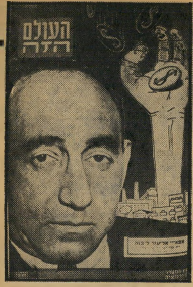
"העולם הזה" 798, תאריך: 12.2.53

גיליון "העולם הזה" שראה את השבוע לפני 25 שנים כדיוק, סיקר בפילמוס ובכתבה את מיכצע הצלתם של שלושה שוטרי מישטרת החופים הישראלית, שפנינתם נצטלה כיום מול חוף הניקרה. היה זה מיכצע ההצלה הראשון מסוגו בארץ, שבו השתתף מסוק של הליהאוויר. כתבת השער הגישה את תיאורו ודיוקנו של חי"ם מפא"י אליעזר ליכנה, מגערי בניגוריון בראשית שנות ה-50, שפעל ככנסת ובמפלגתו להפית דרכה הפוליטית של מפא"י ימנה. כמורר "מחתרת" הובא סיפור של שלושה רבנים קשישים: הרב צבי פסח פראנק (70); הרב זלמן מלבר (80) והרב ראיבן כנגיס (93), שהובאו לבית המושט הירושלמי בשל הפנת