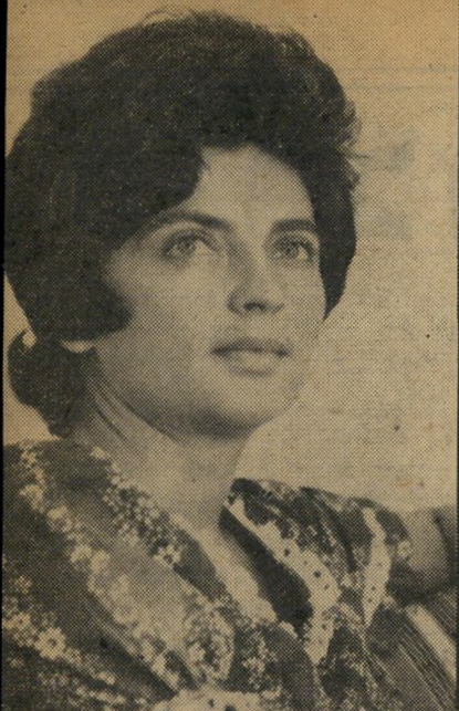
מפיקה פאר ערבים וסמים

בלילה שבו החליט זבולין המר ל-1 דחות את שידור חירבת חיזעה, בעיקבות בקשתו של לבי ארי, אי-אפשר היה למצוא את עמירב במשרד, למרות שבאופן טבעי היה מקומו שם. עשרות העיתונאים ש-