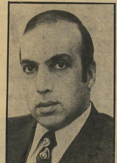
מנחה בראל הכל לבד

באחרונה הבחינו העיתונאים, המסקרים את ישיבות מליאת רשות-השידור, בהתכת-