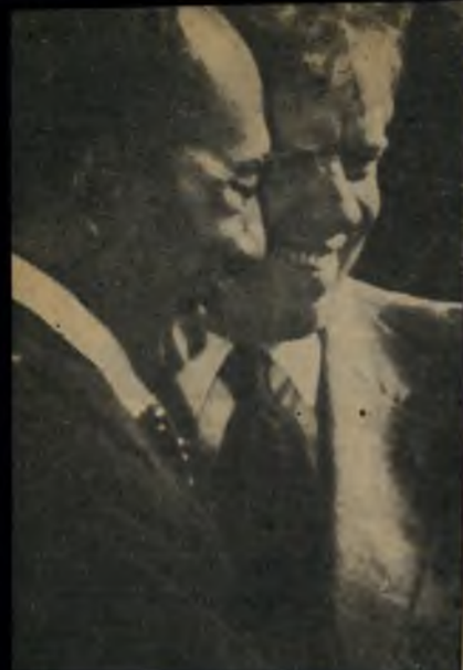
קארטר וסאדאט חיבוקים טכטיים

הישראליים בפיתחת-רפיה, שלא הוצגו כלל בפני קארטר. כאשר נחשפה ההטעייה הזו התגוננה ממשלת-ישראל, באמצעות שר-החוץ משה דיין, כי נאמר לנשיא קארטר בפגישתו עם בגין שיהיו בתוכנית עוד מיספר שינויים, לפני שתוגש לנשיא מצריים.