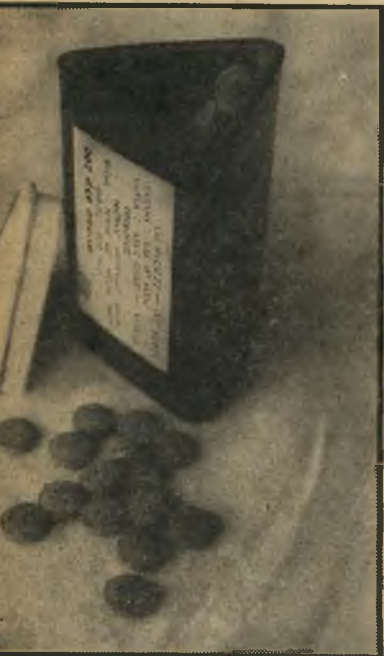
אוצר מונטסומה בכמוסה

בכל העולם המודרני, בחברות השפע, מאבחנים מחלות מחסור, במזוננו חסרים מינרלים, כי אלה חסרים גם באדמה, אך לאושרנו, אנו יודעים היכן לחפש אותם. ואכן, בכל העולם מתפתחת נטייה לצרוך מוצרי ים. ניתן לסמוך על האמריקאים: כי הם לא אלה שיעבדו קשה למען ברי-