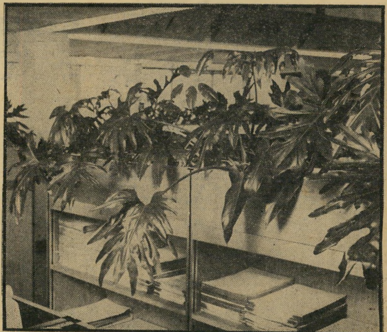
שיטה לצמחים נודדים

הצמח גדל על דשנים מיוחדים המהולים במים. מוסיפים אותם פעם בשלושה חודשים, לפי הוראות הטיפול. כל זאת אחרי