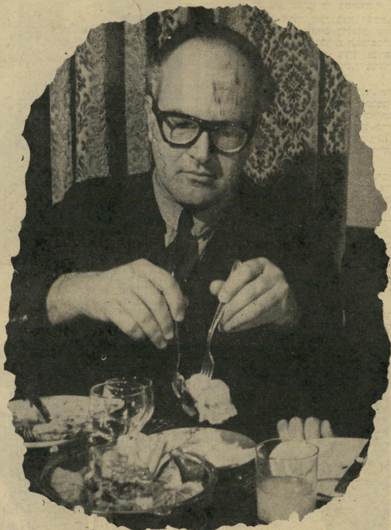
דא-מנכ"ל רגר סנקציות לאחר התפטרות

לאחר שאיישו כל התפקידים בי וועדה לחגיגות ה-30, הגיש רגר, ש