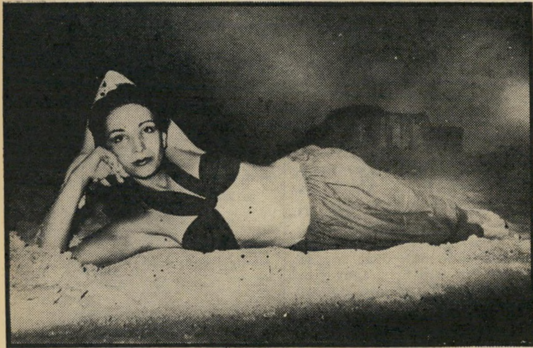
שנית כתר האנגלי זכה

אני מכירה רבים שהיו שמהים לקבל על עצמם לבצע עבודה מסוימת, תמורת שכר נכבד, לגלית במהלך העניין שהם בעצם נהנים מאד, ולשכוח שבאו בעצם לעבוד, לא לבלות.