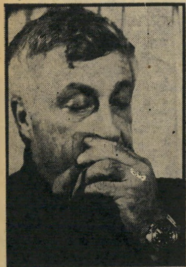
שר החקלאות שרון היהודים שונים מאחרים"

● על ביקור סאדאת בירושלים: "סאדאת לא רצה פרס או פיצוי על המחווה