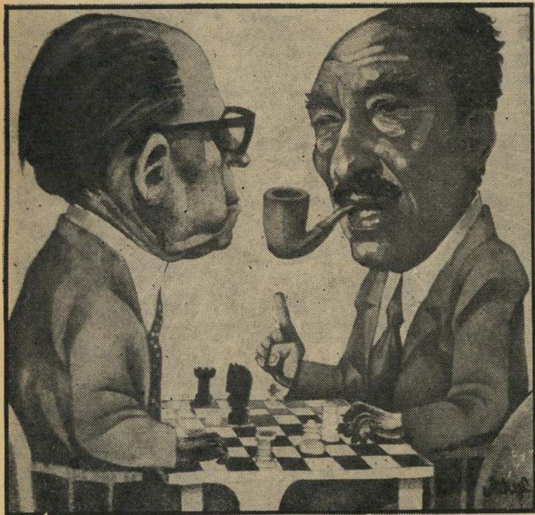
* סאדאט ובגין: "רוז אל-יזסוף" קאהיר