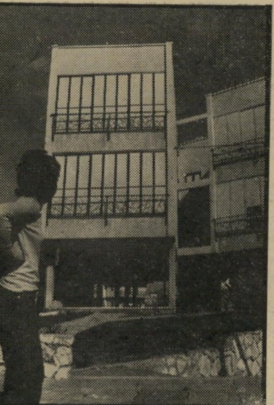
ביתו של שוקי נושא לקינאה

קאהיר מצוירת פתוחה, חמה, לבבית וכנה. השינוי התחולל בירושלים.