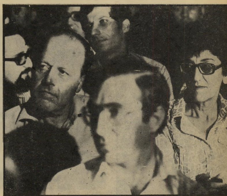
טולידאנו ח"כ שמואל טולידאנו (משמאל), מיוצאי מפלגת העבודה, הצטרף לאנשי שינוי במרד שלהם נגד ידיו. מימין: אלוף-מישנה (מיל), סטלה לוי, עליה זרק ח"כ עקיבא גוף מכשיר טלפון רק משום שהיא לא סידרה לו חדר.