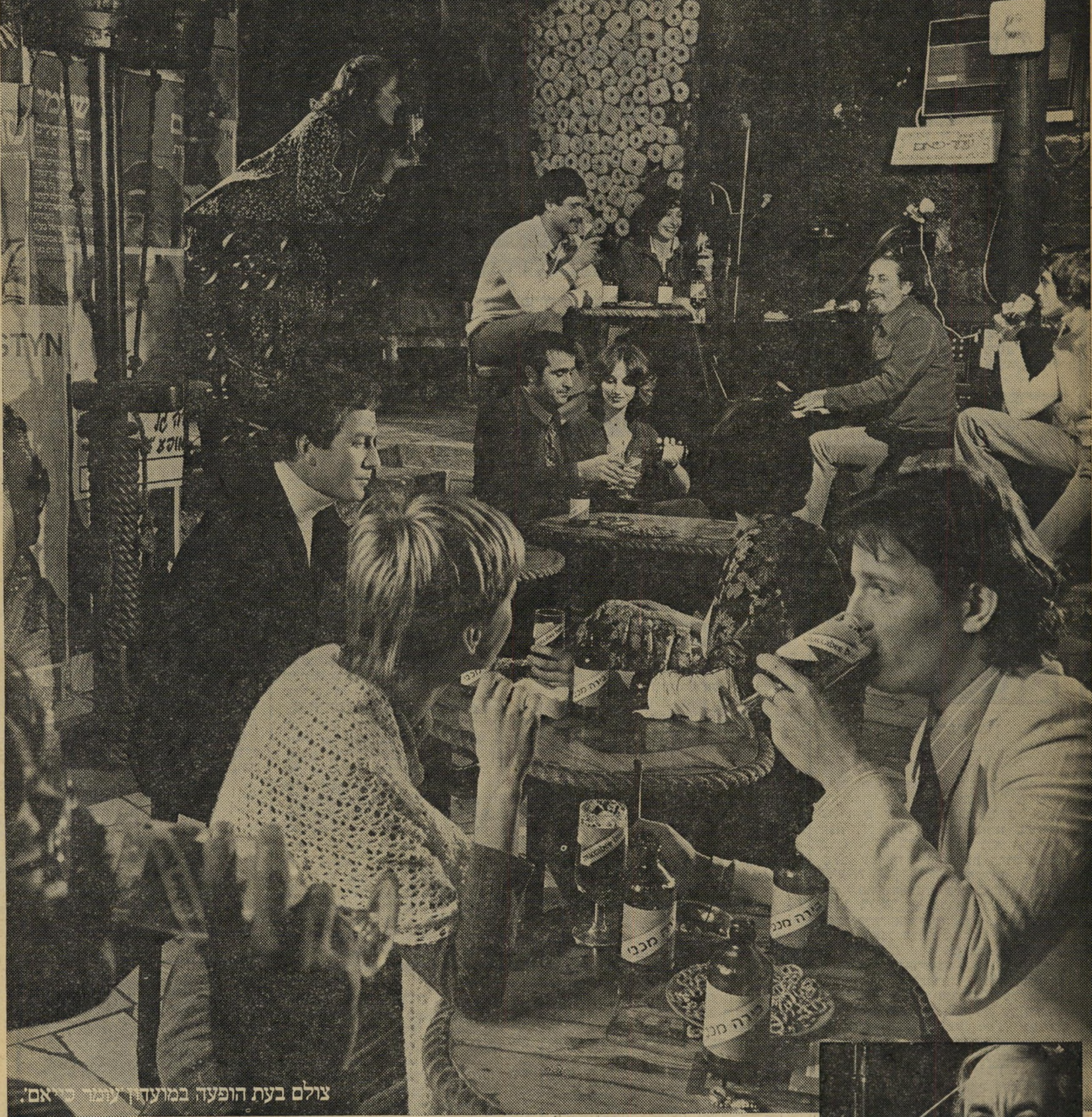
צולם בעת הופעה במועדון 'עומר כייאם'.