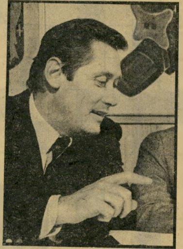
שר-אחריה אנדרוש העיקר יציבות

אולם החל בשנת 1976 החלו הצרות, בגלל עליית שווי השילינג, הצמוד במידה רבה למארק הגרמני. הייבוא גדל, הייצוא קטן, והענף המכניס נסוג. בשנת 1976