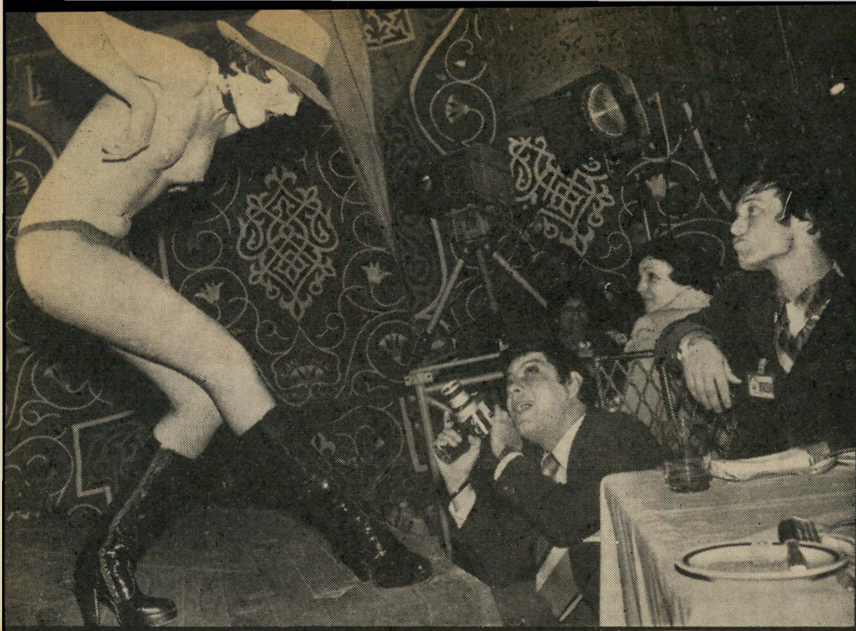
אנשי-ביטחון ישראליים מצלמים חשפנית אנגליה ב"מנה האום" מה תגיד האשה בבית?

זה עודד אותי לשאול אותה: מה, דעתך שנפגש אחרי סיום העבודה?