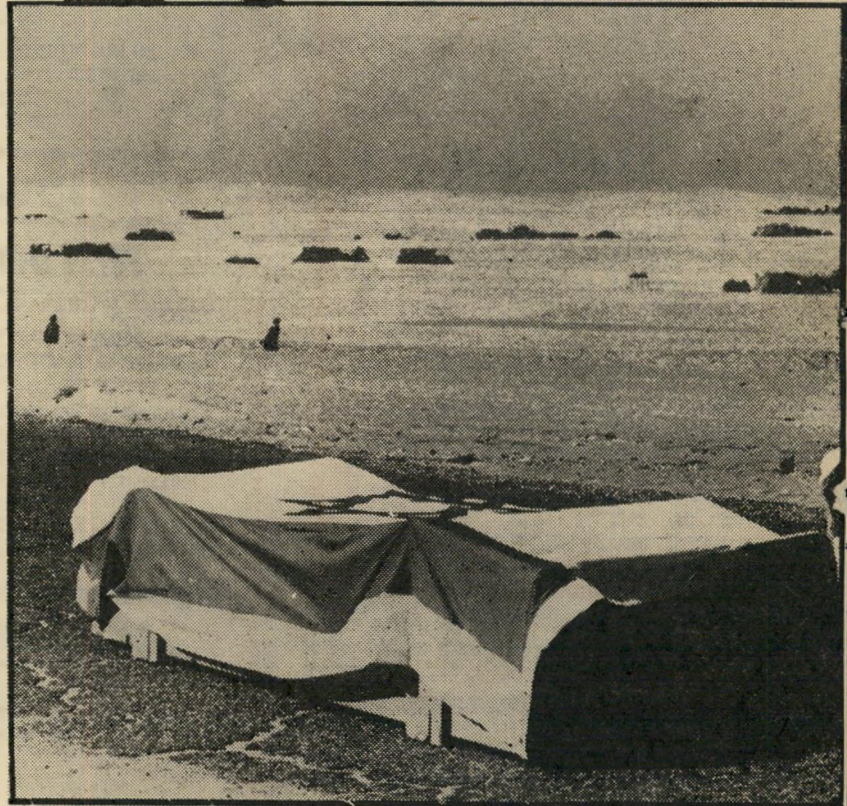
ארון חלד צה"ל בגבול אזור ההפרדה בסיני, במוחם ציוו לנו את החיים.

אחרי-כך, כשהחלה נגואה לרקוד, רצתי תי לצלם אותה. זה לא פייר, אמרתי למארחי, היא רוקדת כמעט ערומה ואני