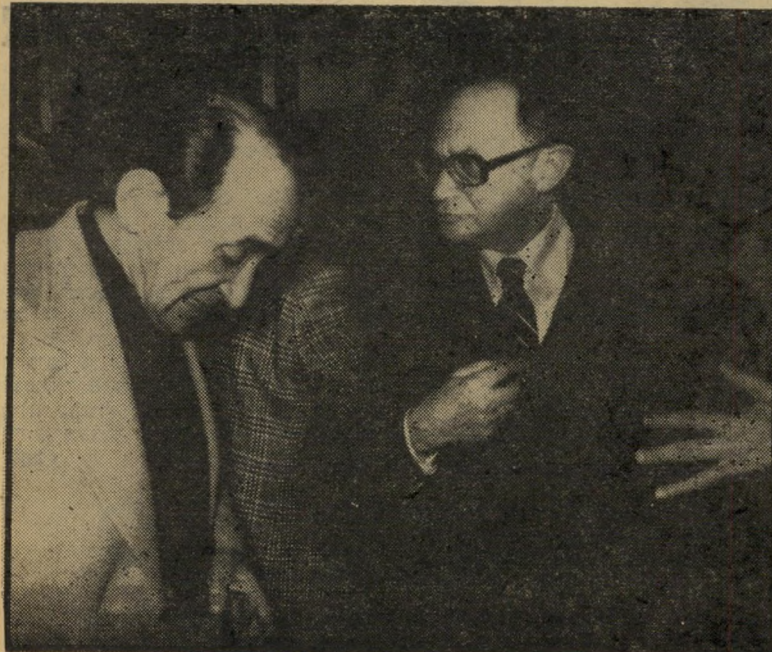
כ"ץ ולנדאו מתווכחים על הנאמנות לבגין

מ נחם בגין רתח מכעם. לא קל להרגיז את סוסי-הקרבות הרפוליטי המנוסה הזה. אין הוא מתגרה כשור בזירה למראה כל מטפחת אדומה המנופפת מול פניו. האיש האמון על שמירת קור-רוח ושלוחת-נפש גם בתנאי-לחץ קשים ביותר אינו ממהר להילכד במלכודות פתאים מילוליות שפורשים לרגליו. צריך להרגיז אותו באמת כדי להוציא משלוותו ולגרות אותו אלי קרב ריטורי. או מתגלה מנחם בגין בשיאו. אשף המילים, אמן הנאום, הלוכד את קהל מאזיניו בקסם של טונים ומימיקות ומשסף את יריביו ללא רחם.