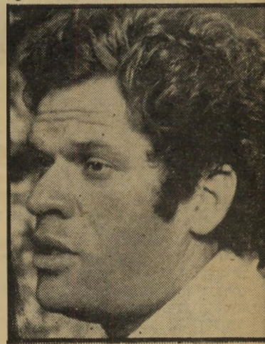
אמנון ברנזון קודם הצילומים

כיום הוא שוהה באמריקה, שם הוא עושה מחדש את הסרט כנפיים, שאותו התחיל בארץ אבל נתקל בבעיות כספיות רציניות. הוא נסע לארה"ב ושם, אחרי חיפושים, מצא מממנים רציניים וקעת קיים סיכוי סביר שעוד גזכה לראות את הסרט בימינו אמן.