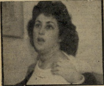
בת מירב גרי תיאטרון ניסיוני

ה קבוצה זרקת לי את הישראלית שלי בתור אתגר. הם אמרו לי: אתם עירובי של תרבויות, מי אתם בכלל? פיפ, שהיית לו בעייה, לא רצה לשמוע