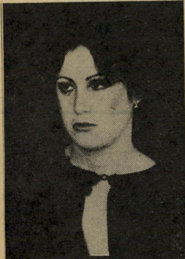
אם פנינה גרי העץ של התפוח

מישראל. יחד עם זאת, החברה אהבו כשר שרתי שירים בעברית. הייתי לוקחת גיי טארט חשמלית ושרה את מי יתנוני עוף, והיינו עושים לזה עיבוד רוק-ני-רול.