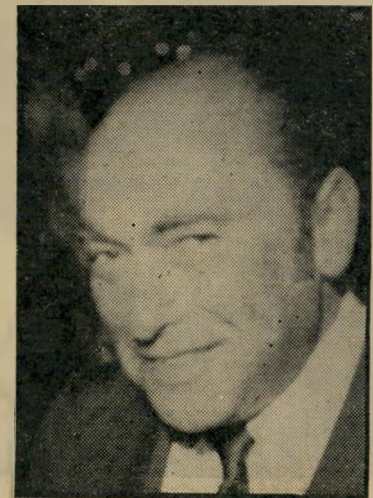
מנהל דוברת לטובת מי?

בראשית שנת 1977 היו ל„אזורים“ הפסדים בסך 80 מיליון לירות. כעבור שנה נמחקו כל ההפסדים ויש אפילו רווח צנוע, מאחר שהשנה היתה שנת קיפאון בבנייה, נמחקו ההפסדים על-ידי סיבסוד של „כלל השקעות“. חברת האם הילווה, למשל, ל„אזורים“, 70 מיליון