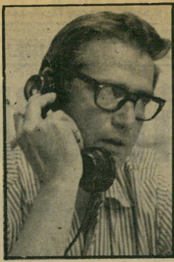
מנהל רדיו פינסקר חמי הגיבוי?

שנה קודם-לכן ניסה הומינר לשכנע את ראש עיריית רמת-גן בדרך אחרת. הוא ביקש מראש העיר שיבוא למקום ויבדוק אם אפשר לגור בתנאי-החיים שקשת מכי תיבה. אז לא ניא את ראש העיר לשמוע (המשך בעמוד 36)